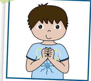
changer la couche